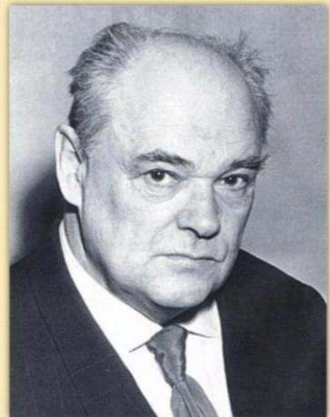
Евгений Иванович Чарушин (1901 - 1965)

Дети второй младшей группы слушали рассказ Е Чарушина «Томкины сны». Ребята знакомились с миром животных глазами автора.