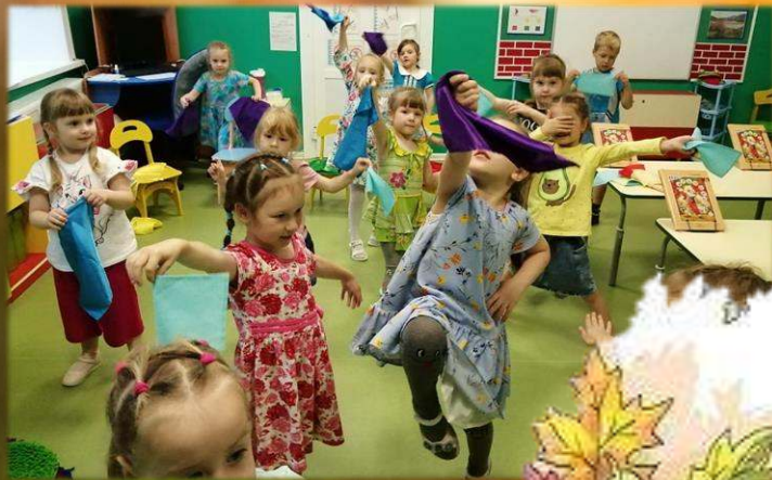
Времена года в музыке А. Вивальди