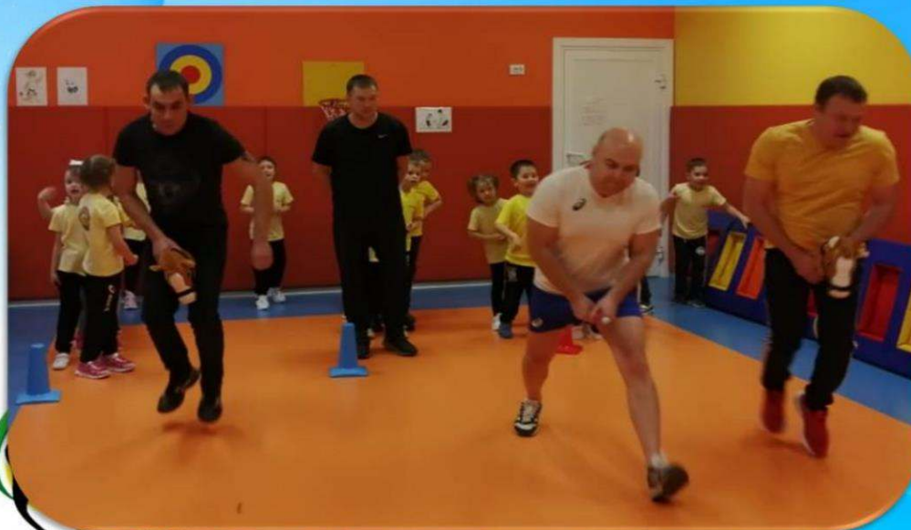
Наши папы молодцы, наши папы удалцы!