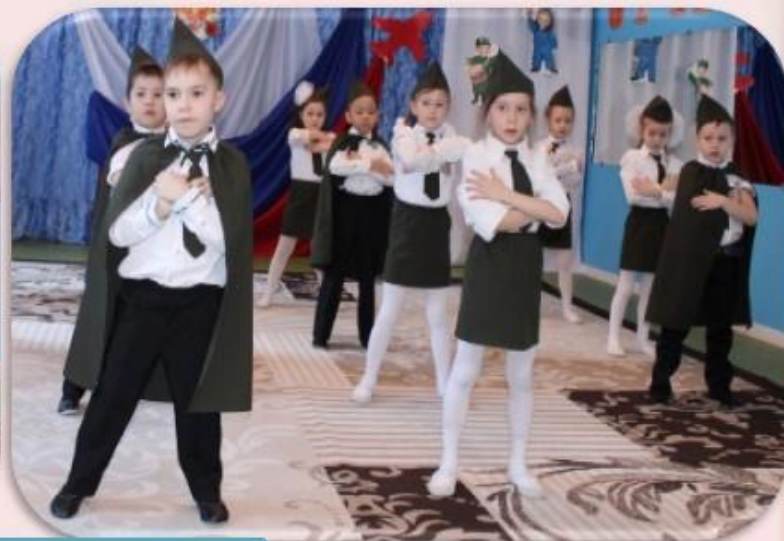
Спортивная композиция «Служить России!»