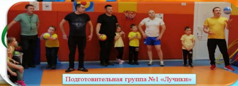
Подготовительная группа №1 «Лучики»