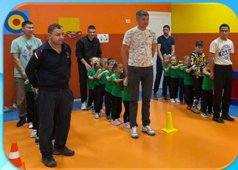
Средняя группа №2 «Пчелки»

Мероприятие направлено на привлечение внимания к значимости роли отца в семье, популяризацию семейных ценностей.