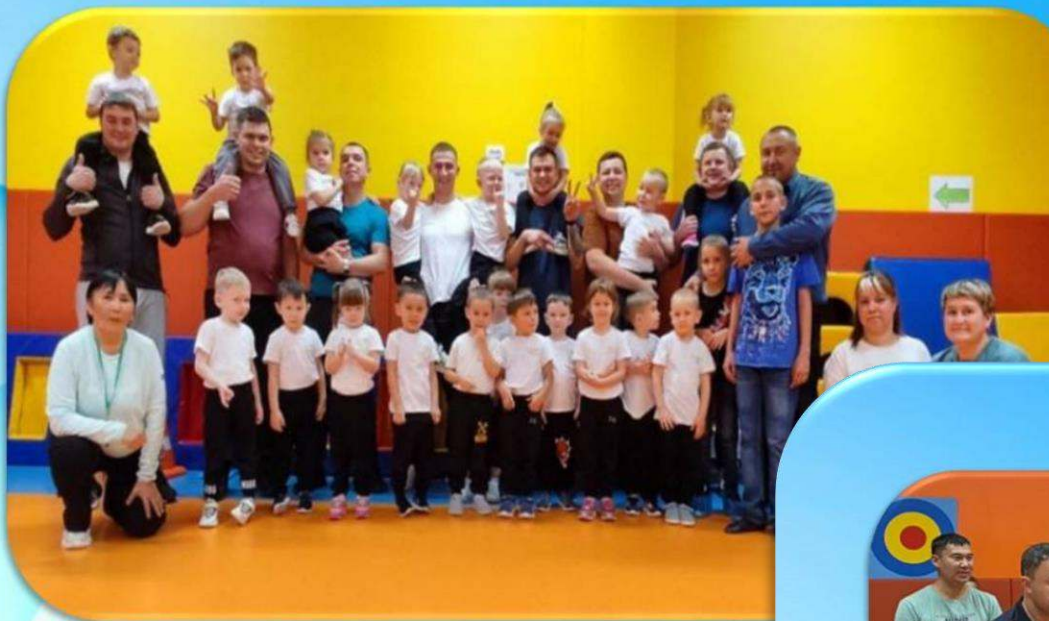
Средняя группа №2 «Пчелки»

Девиз: «Чтоб расти нам сильными, Ловкими и смелыми, Ежедневно по утрам! Мы зарядку делаем!».