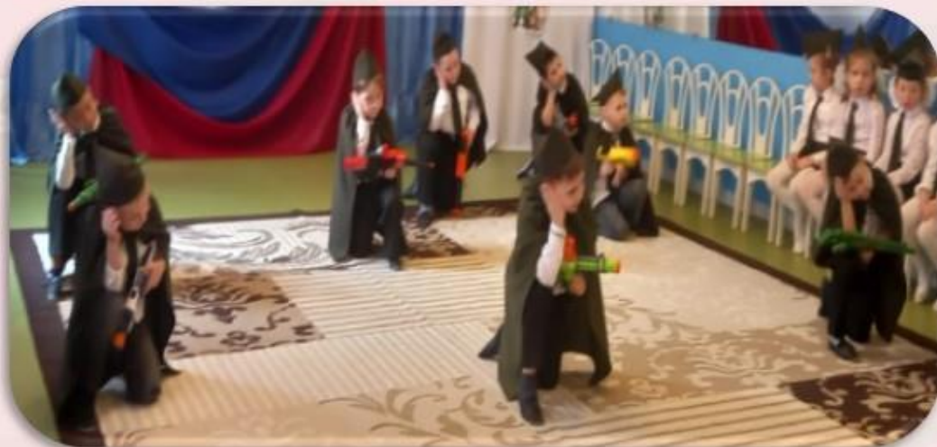
Танец «Пацаны стоят в строю» Подготовительная группа №2