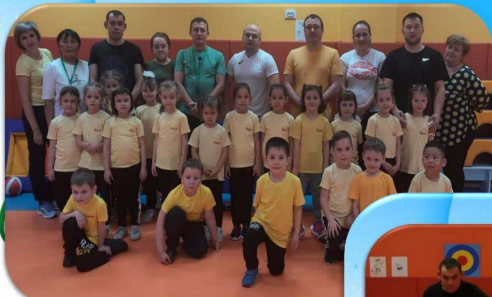
Подготовительная группа №1 «Лучше»

Команда: «Спортивные ребята» Девиз: «Все мы спортом заниматься любим с самого утра! И приветствуем, ребята, громким вас «Физкульт-ура»