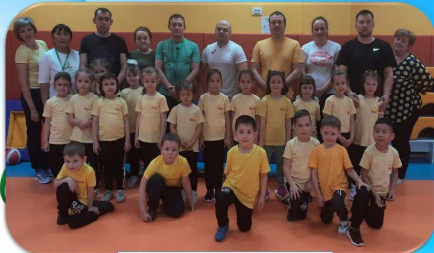
Подготовительная группа №1 «Лучики»

Команда: «Спортивные ребята» Девиз: «Все мы спортом заниматься любим с самого утра! И приветствуем, ребята, громким вас «Физкульт-ура»