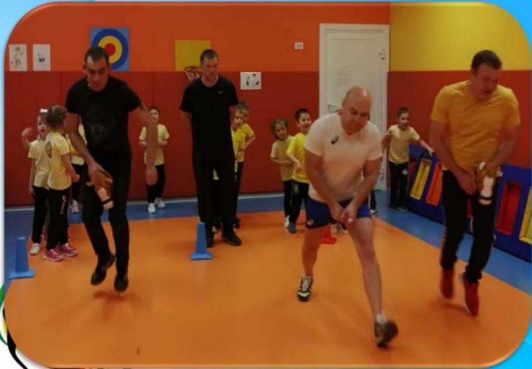
Наши папы молодцы, наши папы удалцы!

Команда: «Спортивные ребята» Девиз: «Все мы спортом заниматься любим с самого утра! И приветствуем, ребята, громким вас «Физкульт-ура»