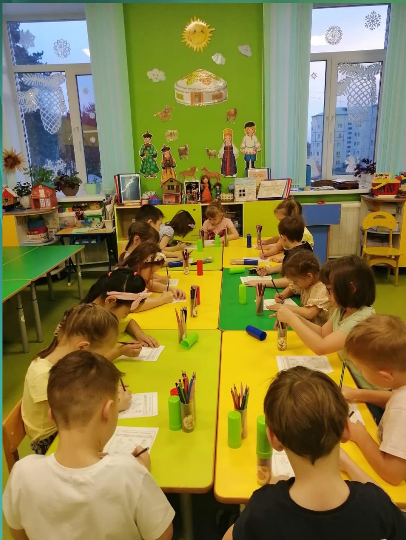
Работа за столом «обведи и раскрась»